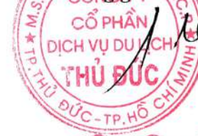
Đào Đức Cang